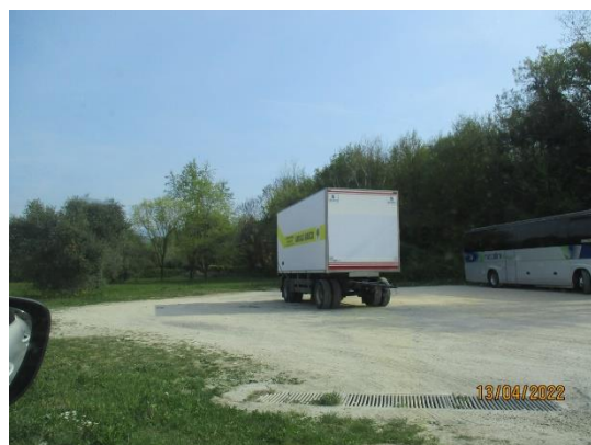
Terreno nei pressi della sede del Gruppo di Protezione Civile Volontari del Garda, dove prenderemo dati geoelettrici, a Salò

Si forniscono nel seguito brevi CV dei relatori ed organizzatori