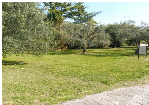
Prato con ulivi nei pressi di un'antica villa romana, dove prenderemo dati georadar, a Toscolano Maderno

Sono nel seguito mostrati i luoghi nei quali si svolgeranno le esercitazioni all'aperto.